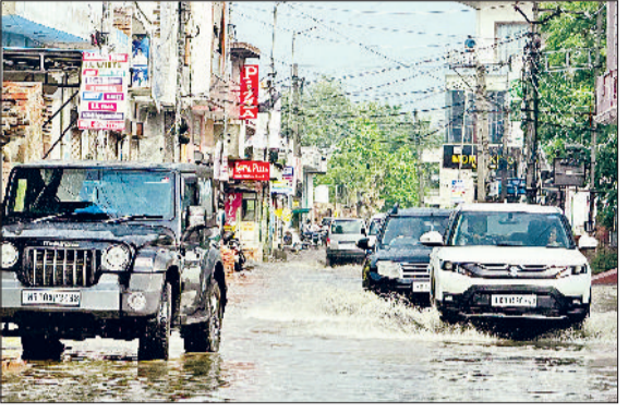
सोनीपत। सूरी पेट्रोल पंप वाली गली में जलभराव से निकलते वाहन व वेस्ट रामनगर में जलभराव से निकलते दुपहिया वाहन चालक।