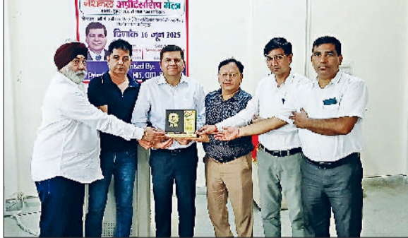
सोनीपत। रोजगार मेले में पहुंचे अतिथियों का स्वागत करते हुए।

राजकीय औद्योगिक प्रशिक्षण संस्थान में सोनीपत में सोमवार को प्रधानमंत्री राष्ट्रीय अप्रेंटिसशिप मेले का आयोजन किया गया, जिसमें राई, कुण्डली, बड़ी, खरखौदा तथा अन्य औद्योगिक क्षेत्रों से 25 औद्योगिक प्रतिष्ठानों ने भाग लिया। रोजगार मेले में इस वर्ष आईटीआई में जुलाई 2025 में आयोजित होने