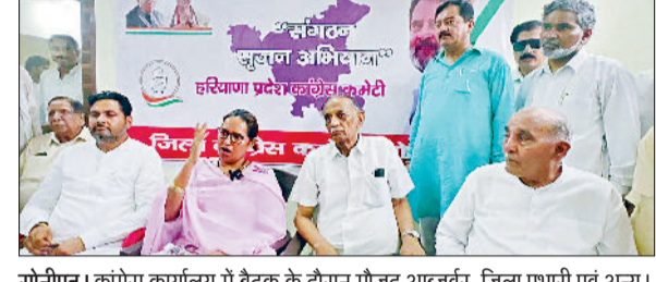
सोनीपत। कांग्रेस कार्यालय में बैठक के दौरान मौजूद आञ्जर्वर, जिला प्रभारी एवं अन्य।

कांग्रेस में जिलाध्यक्ष की नियुक्ति को लेकर काम तेज हो गया है। सोमवार को संगठन के सृजन करने के लिये महाराष्ट्र की सांसद एवं सोनीपत की आञ्जर्वर प्रो. वर्षा एकनाथ गायकवाड़, जिला प्रभारी पूर्व विधायक संत कुमार के साथ कांग्रेस जिला कार्यालय में पहुंची। उन्होंने कांग्रेस के वरिष्ठ नेताओं, विधायक व पूर्व विधायकों के साथ मंत्रणा के बाद वरिष्ठ कार्यकर्ताओं के साथ अलग-अलग बातचीत की और जिला अध्यक्ष की नियुक्ति को लेकर उनके मन की बात जानी।