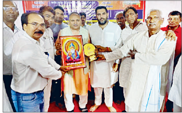
सोनीपत। कार्यक्रम में पहुंचे विधायक एवं मेयर का स्वागत करते समिति के पदाधिकारी एवं सदस्यगण।

सीएमओ का तबादला, दोनों अस्पतालों की उच्चस्तरीय जांच, सीएमओ और पीएमओ की जिम्मेदारी तय करना, बच्चों के लिए पीआईसीयू सुविधा बहाल करना, अस्पताल में रखे 22 वेंटिलेटर पर ऑपरेटर नियुक्त करना, ओपीडी स्लैप के लिए 8 काउंटर शुरू करना, चार्जशीटेंड डॉक्टरों को हटाना, ब्लॉकपोनेंट मशीनों और नया भवन बनवाना और नागरिक अस्पताल की सभी सेवाएं बेहतर करना शामिल हैं।