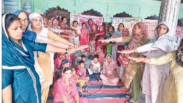
गोहाना। महिलाओं को बाल विवाह रोकने की शपथ दिलाते हुए।